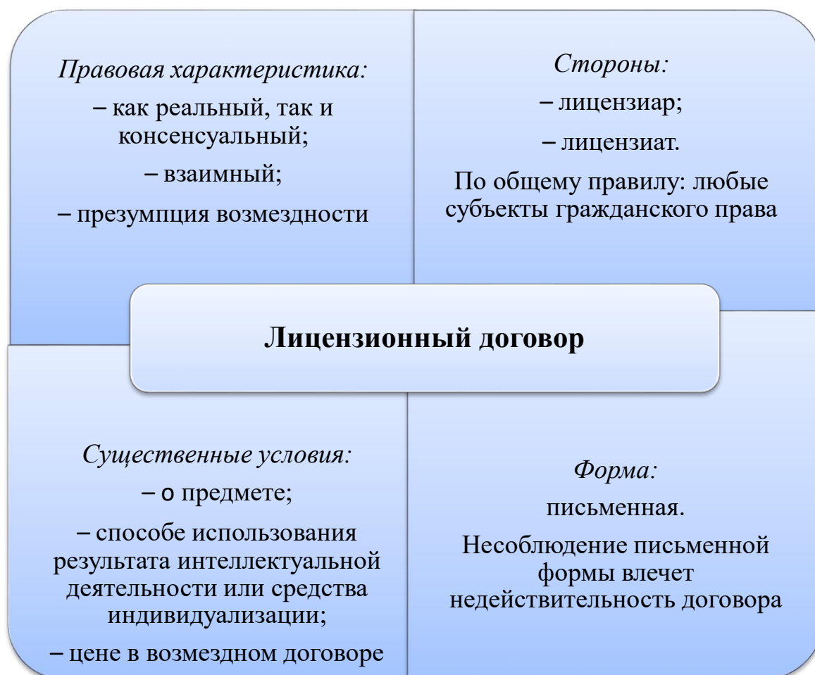
Рис. 1. Лицензионный договор