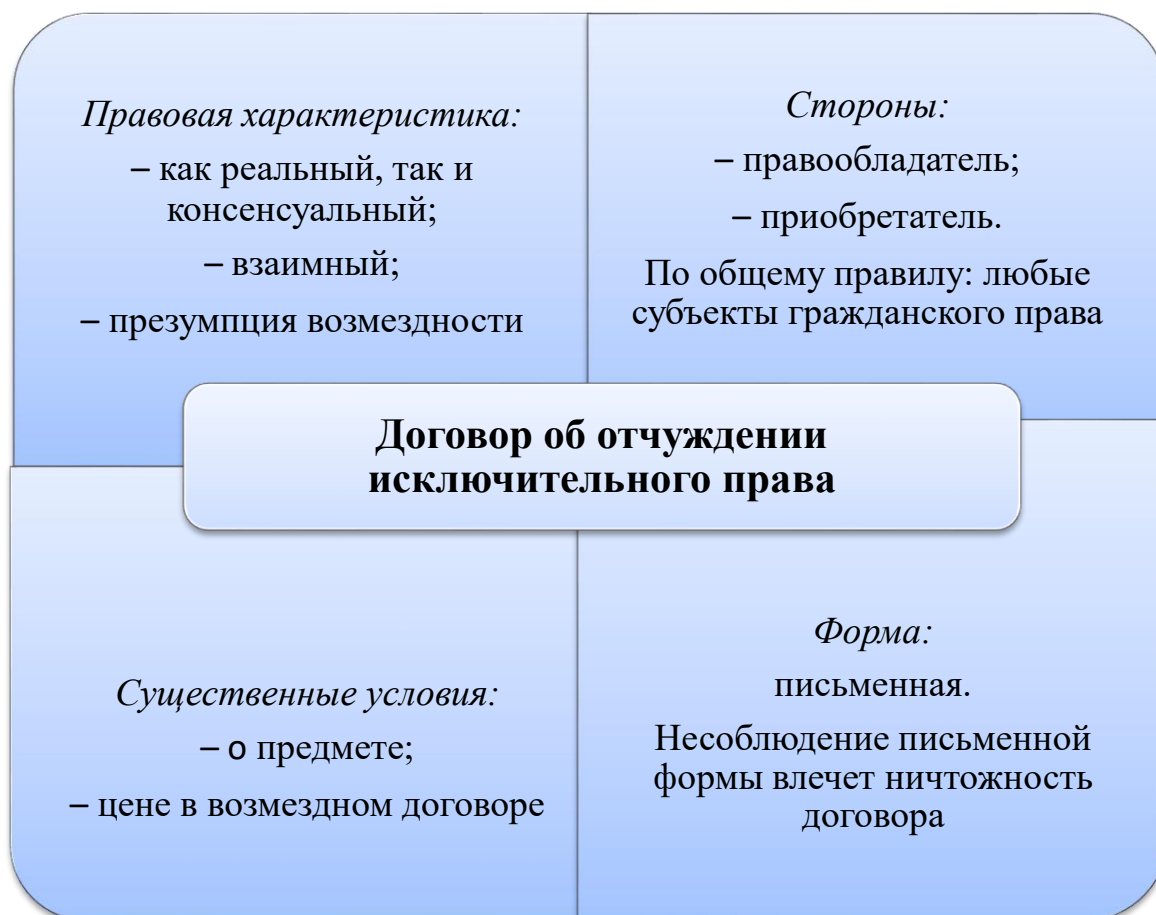
Рис. 3. Договор об отчуждении исключительного права

Для наглядности схематично изобразим правовую характеристику и элементы договора об отчуждении исключительного права (рис. 3).